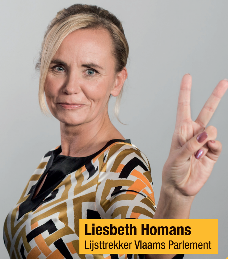
Liesbeth Homans Lijsttrekker Vlaams Parlement

Als burger, als vader en als burgervader zoek ik elke dag oplossingen voor en het welzijn van iedereen die werkt, spaart en onderneemt. Maar zolang we België niet hervormen, staan we machteloos tegenover de hoge belastingen, de faillissementengolf, de verkwistende structuren.