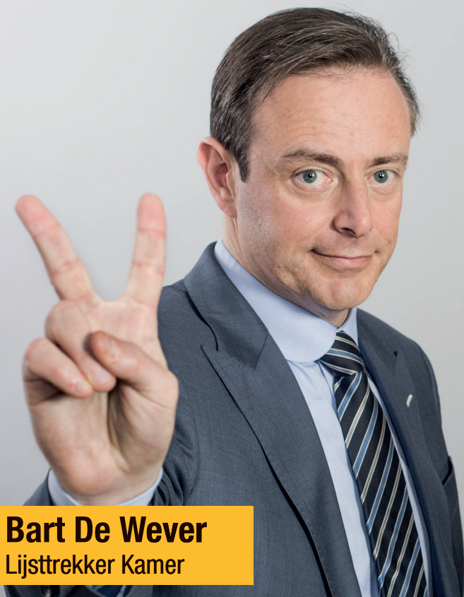
Bart De Wever Lijsttrekker Kamer