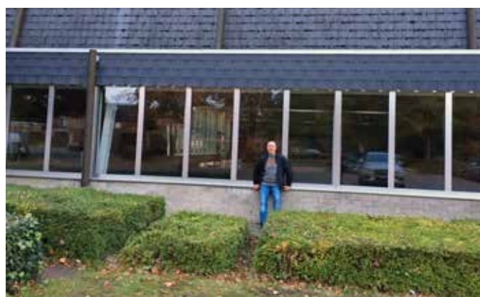
▲ Het zwembad in onze gemeente staat al meer dan een jaar leeg.

In de gemeenteraad van oktober vertelde de bevoegde schepen dat men pas in januari van dit jaar die andere gemeenten contacteerde. Per brief. Nadien duurde het zes maanden vooraleer men opnieuw ging samenzitten. Gewoon even bellen of een meeting via Teams organiseren is toch niet zo