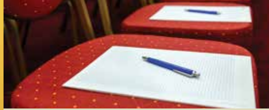
Oppositie monddood gemaakt (p.2)