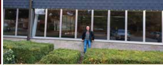
Dan toch een nieuw leven voor Nijlens zwembad? (p.4)