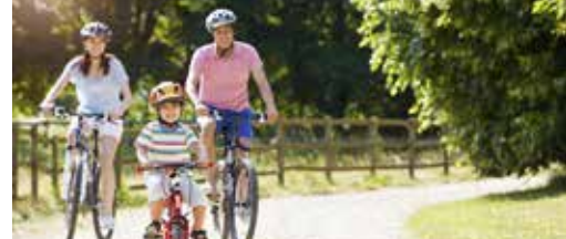
Fiets en feest op 11 juli! p.3