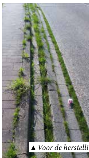
▲ Voor de herstelling.