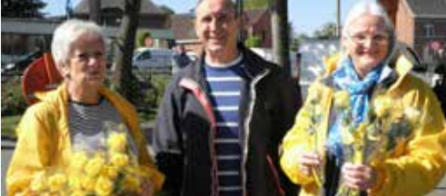
N-VA Nijlen in actie p.2