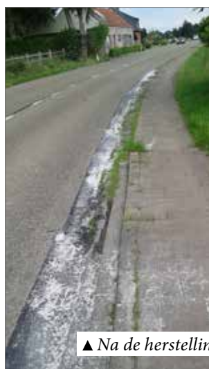
▲ Na de herstelling.

Op zondag 11 juni werd de internationale wielervedstrijd Spar-Flanders Diamond Tour voor Dames in Nijlen gereden. Een leuk sportief initiatief, maar het wegdek was op bepaalde plaatsen verzakt.