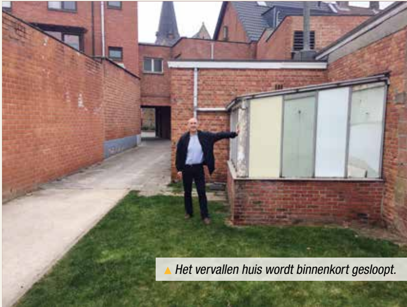
▲ Het vervallen huis wordt binnenkort gesloopt.