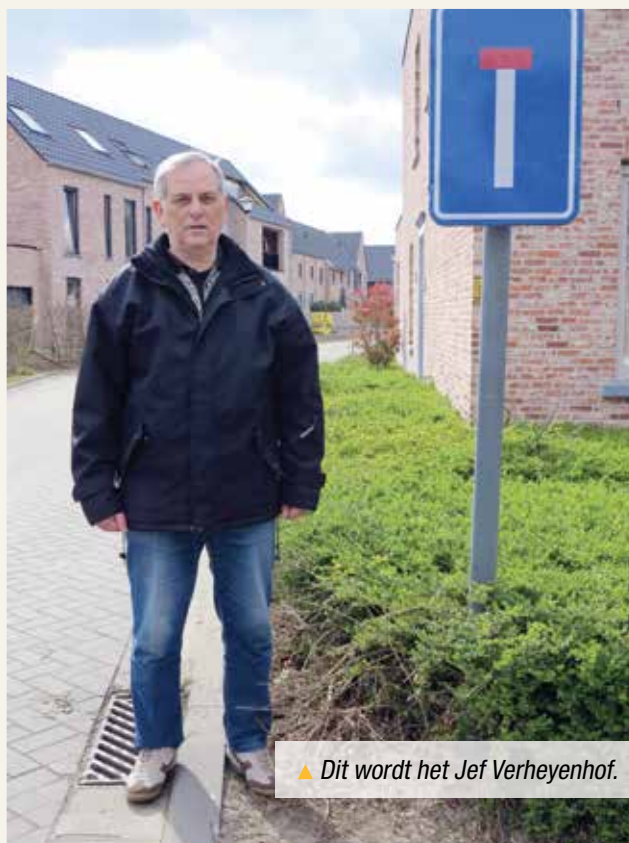
▲ Dit wordt het Jef Verheyenhof.